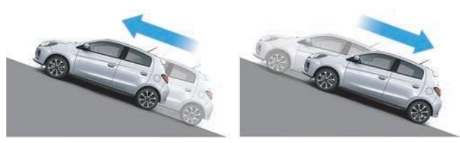
With Hill Start Assist Cu asistență la pornirea din rampă